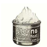
Sterno Canned Heat

W latach 20-tych był już alkoholikiem i wędrowym grajkiem podróżującym wzdłuż całego Południa, niekiedy towarzyszył mu Papa Charlie McCoy. W 1928 roku z McCoy'em nagrali pierwszą partię bluesów dla wytwórni Victor Records. " Canned Heat Blues " został nagrany 31 sierpnia 1928 roku w Memphis, Tennessee.