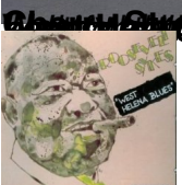
Roosevelt Sykes - West Helena Blues