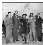
Rafael Hernández y su Cuarteto Victoria

Miguel Zenón: „Rafael Hernandez jest prawdopodobnie najbardziej znanym Portorykańczykiem na świecie w historii. Jego osiągnięcia są niemalże zbyt duże do wymienienia; stanowił część James Reese Europe's 'Hell Fighters', żył na Porto Rico, w Meksyku i na Kubie i wszędzie tam był uważany za skarb narodowy. Był niewiarygodnie płodnym i wszechstronnym kompozytorem, który napisał sporo z najlegendarniejszych piosenek w historii muzyki latynoskiej. Muzyczny gigant w każdym sensie tego słowa.”