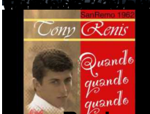
Tony Renis - Quando Quando Quando