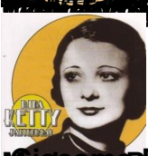
Madama Butterfly - Humming Chorus