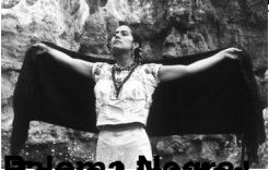
Paloma Negra - Paloma Negra